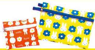
ミッフィーフラットポーチセット

今までお取引がなく、初めて以下のお取引を開始いただいた方に、 もれなくプレゼント。